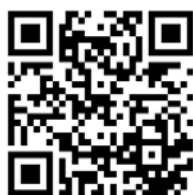
Protocolo de Monitoramento do Projeto Boi na Linha